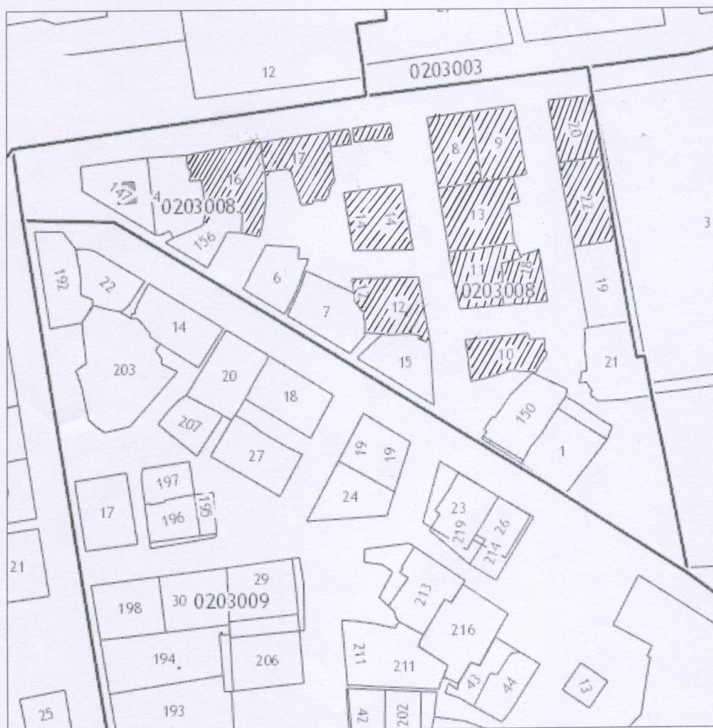
СХЕМА РАСПОЛОЖЕНИЯ РЕЗЕРВИРУЕМЫХ ЗЕМЕЛЬ