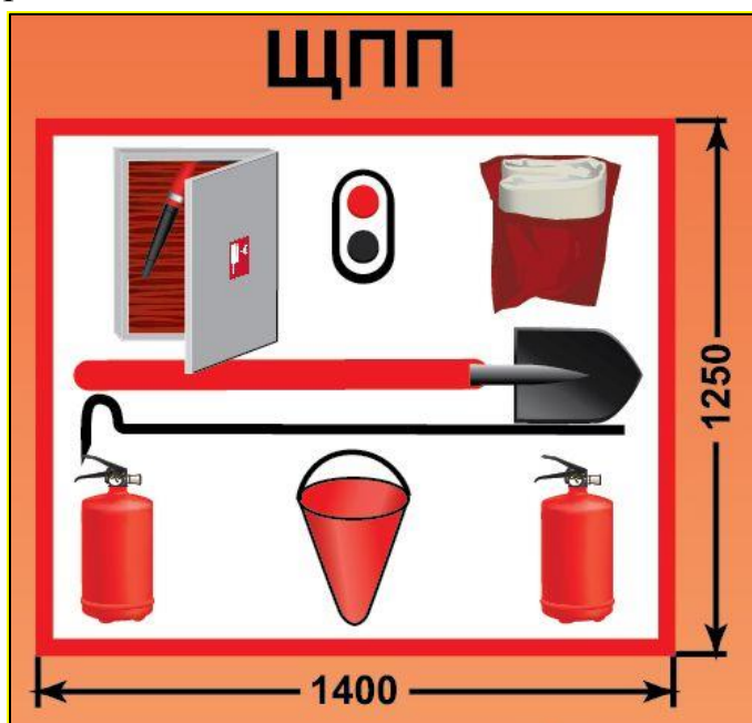
ЩПП – щит пожарный передвижной