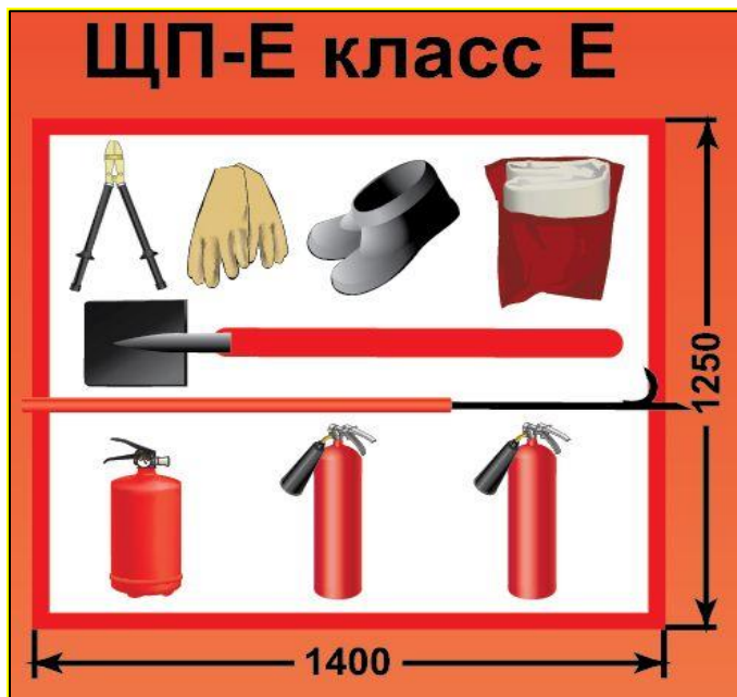
ЩП-Е – щит пожарный для очагов пожара класса Е